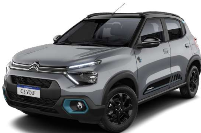
Gris Niebla + techo negro